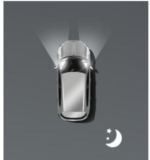
Автоматичне дальнє світло