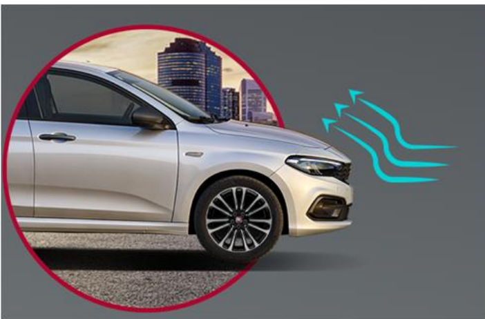
Активна заслонка решітки радіатора