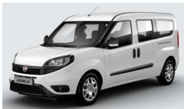
Забарвлення кузова пастельною фарбою білого кольору (код 249)