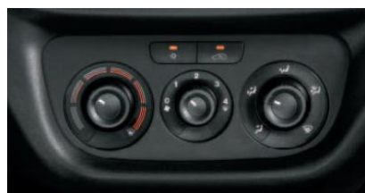
Кондиціонер з ручним регулюванням