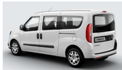
Забарвлення кузова фарбою металік (код 293)