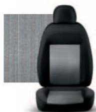
PIN STRIPE GRIGIO 223