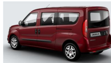
Забарвлення кузова фарбою металік (код 612)